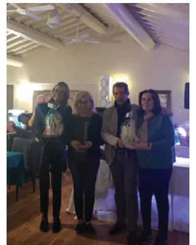
La premiazione del burraco del 26 febbraio al Golf Club Casalunga