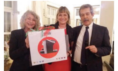
La consegna del primo premio della sottoscrizione di Natale: una macchina da caffè offerta da Caffitaly