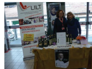
Le nostre volontarie a uno degli stand allestiti per la settimana