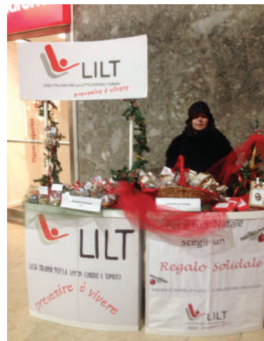
Punto di raccolta fondi in occasione del Natale