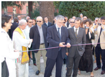
Inaugurazione della nuova sede di via Turati alla presenza del sindaco Cofferati

Dal 2000 la Sezione di Bologna è guidata dal Prof. Domenico Francesco Rivelli che ha orientato l'attività verso programmi che affrontano la complessità della prevenzione oncologica: la prevenzione primaria con l'educazione alla salute, la diagnosi precoce con le visite proposte ai cittadini, la prevenzione terziaria con i progetti di supporto al paziente oncologico. Tappa fondamentale che ha consentito l'avvio di tanti progetti è stata l'apertura nel 2006 della nuova sede in via Filippo Turati 67 con l'allestimento di due ambulatori.