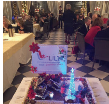
La torta alla cena degli auguri di Natale